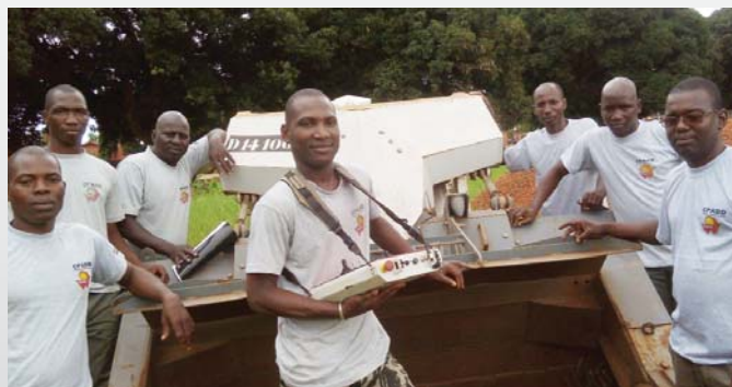
Les cours de déminage mécanique continuent également à être dispensés sur la DIGGER D-2 du CPADD.

La Fondation Digger collabore depuis 2007 avec le Centre de Formation au Déminage Humanitaire du Bénin (CPADD), destiné à former les professionnels du domaine de toute l'Afrique de l'Ouest.