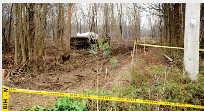
Un champs de mines...