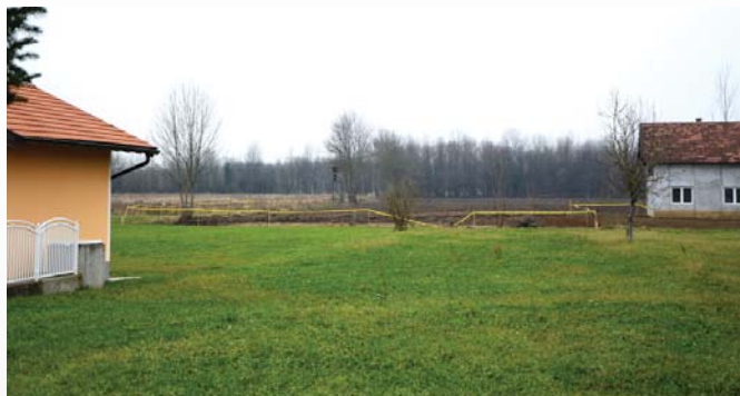
Les maisons délaissées...

Sur place, début novembre 2015, la brume matinale se lève et laisse apparaître des champs cultivés là où, un an auparavant, des banderoles « danger mines » interdisaient l'accès ! Les dangers mortels ont laissé la place aux cultures. Quel encouragement et quel impact positif pour la population !