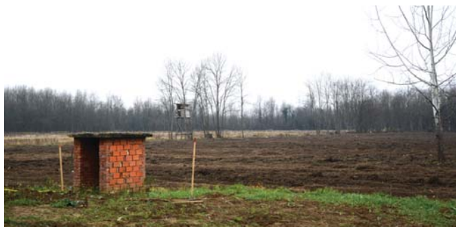
Une menace de mort...