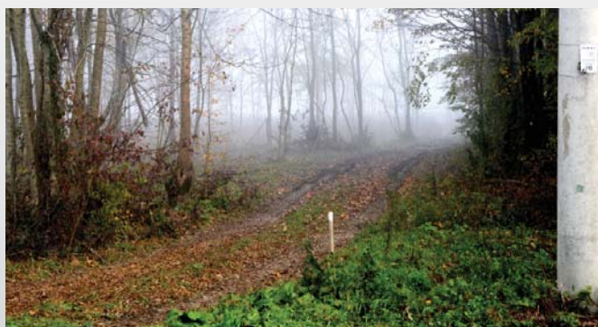
...laisse la place à un accès forestier comme on en trouve chez nous.