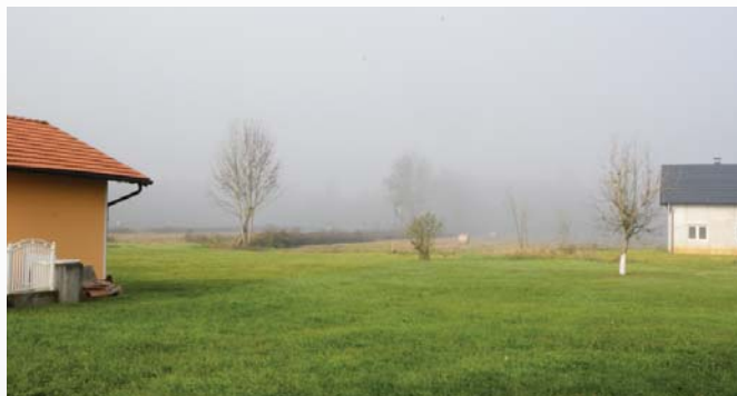
...sont reconstruites, rénovées.

La collaboration entre NPA, le Bataillon de Déminage et DIGGER a été excellente, à tel point que le responsable de NPA pour l'Europe de l'Est souhaite publier la manière de d'agir durant cette opération, ce qui pourrait servir de modèle pour de futures actions et d'autres partenariats. Cette opération ne s'achève pas là. NPA a trouvé les fonds nécessaires pour faire fonctionner la machine en 2016, apportant la promesse d'autres nouvelles positives.