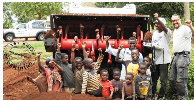
Les citoyens du Mozambique, premiers bénéficiaires, peuvent enfin crier victoire !

La machine DIGGER D-3, utilisée de manière intensive et efficace par notre partenaire, a été un acteur important de ce magnifique succès.