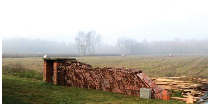
...transformée en champs cultivés.

Un an après que le travail de la D-250 a commencé en Bosnie avec notre partenaire Norwegian People's Aid et le Bataillon de Déminage de l'armée bosnienne, il était temps de se rendre sur place pour évaluer les résultats et faire un bilan du travail effectué. Nous avons déjà les chiffres et la confirmation que les objectifs avaient été dépassés, mais il manquait quelques images confirmant la théorie.