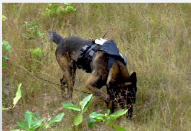
Die erste Version des Systems ist nicht stabil genug und stört den Hund

Der Track des im Geschirr montierten GPS-Geräts,