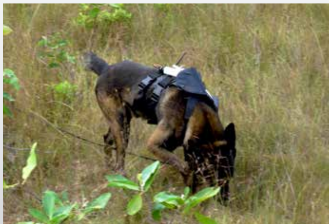
La première version du système n'est pas assez stable et gêne le chien

Le tracé du GPS monté dans le harnais, visualisé à distance sur le téléphone mobile du maître-chien,