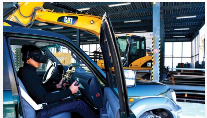
Der Bediener kann den Bagger aus sicherer Distanz steuern (siehe Kasten).

Rückkehrern eine sichere Ankunft zu gewährleisten und um jeden Preis weitere Opfer zu vermeiden. Seit mehr als einem Jahr sind wir bestrebt, eine Lösung für diese Herausforderungen zu finden. Es ist ein Wettlauf mit der Zeit; die Nachrichten erinnern uns täglich daran. Um rascher zu einem Ergebnis zu kommen, konzentrieren wir uns derzeit auf eine Basisversion des SCRAPER, die noch in diesem Jahr einsatzbereit sein wird. Unser Ziel ist es, ein breites und kostengünstiges Angebot bereitzustellen zu können. Die Vollversion des SCRAPER, die für professionelle Minenräumer bestimmt ist, wird de-reinst mehr technische Optionen bieten, namentlich was die Datenverarbeitung sowie die Steuerung durch den Bediener anbelangt.