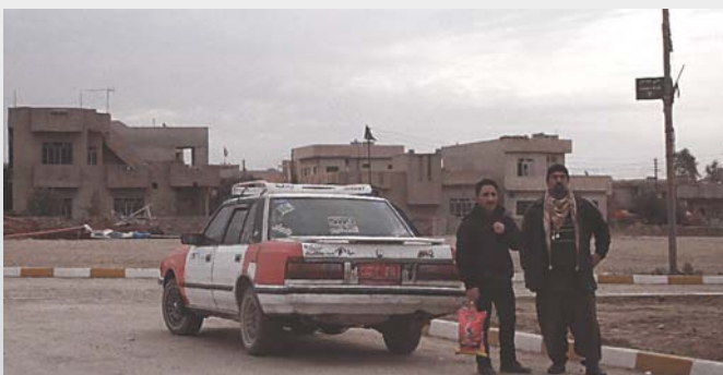
Die Bewohner möchten so rasch wie möglich in ihre Wohnungen und Häuser zurückkehren.

Menschen, die aus ihren Dörfern, aus ihrer Heimat fliehen mussten, warten erwiehenermassen nicht lange, bevor sie zurückkehren. Sie wollen sich zunächst ein Bild von den Schäden machen und allenfalls übrig gebliebene Habseligkeiten retten, um sodann eine definitive Rückkehr ins Auge fassen, selbst dann, wenn dies mit grossen Risiken verbunden ist. Unter den Trümmern und all dem Schutt können Sprengkörper liegen geblieben oder aber von den kämpfenden Truppen absichtlich gelegt worden sein. Die Zeit zwischen dem Ende der Kampfhandlungen und der Rückkehr der Bewohner kann folglich sehr kurz sein. Von daher ist es von grösster Wichtigkeit, rasch zu handeln, um den