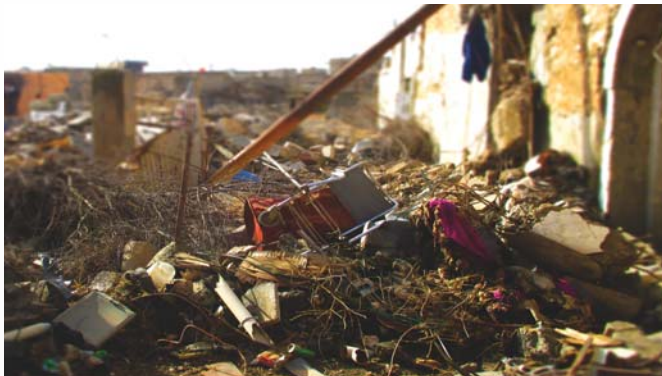
In den meisten betroffenen Städten sind die Schäden beachtlich, und in den Trümmern sind oftmals Sprengfallen aufgestellt.

Während meiner Reise hatte ich Gelegenheit, einigen Menschen zu begegnen, die durch die Stadt zogen oder in Räumlichkeiten, die einst ihr Zuhause waren, nach persönlichem Hab und Gut suchten.