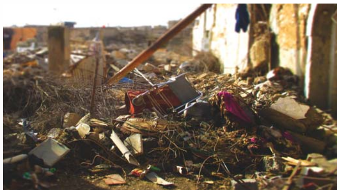
Les dégâts sont considérables dans la plupart des villes touchées et des pièges explosifs sont souvent disposés dans les gravats.

C'est dans le cadre d'un partenariat avec GEODE (Global EOD Experts : www.geode.lu/fr/presentation ) que je me suis rendu dans le nord de l'Irak, fin 2016, dans des zones reprises au groupe Daesh. Entre les maisons saccagées et brûlées, les rues désertes ou les bâtiments effondrés, le paysage est sinistre et les villes sont pratiquement vides de toute présence humaine. Mais pour combien de temps encore ? Il était possible, lors de mon voyage, de rencontrer tout au plus quelques personnes de passage en ville ou essayant de retrouver des effets personnels de ce qui fut un jour leur maison.