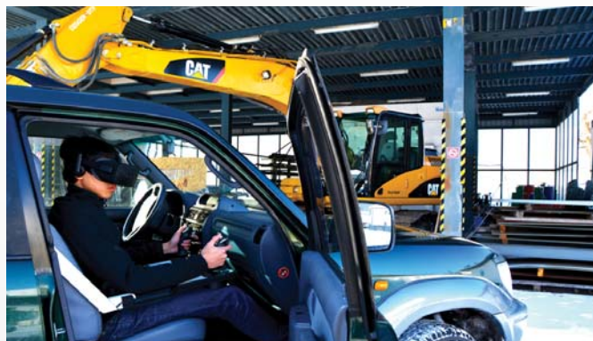
L'opérateur peut piloter l'excavatrice à distance (voir encadré).

manière sécurisée et éviter à tout prix des victimes supplémentaires . Depuis plus d'un an, nous nous attelons à résoudre cette équation, qui est une véritable course contre la montre ; les actualités nous le rappellent chaque jour. Pour accélérer le processus, nous nous focalisons sur une version de base de SCRAPER qui sera opérationnelle cette année encore. A terme, le but sera de la distribuer à large échelle et à moindre coût. La version complète de SCRAPER sera destinée aux démineurs professionnels et offrira davantage de possibilités notamment au niveau du traitement des données et de la gestion de l'opération par le superviseur.