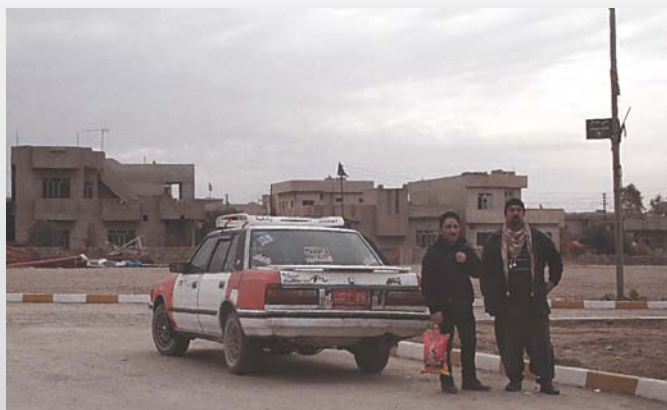
Les habitants souhaitent retourner chez eux au plus vite.

Car c'est un fait : les gens ayant fui leur village, leur terre natale, n'attendent pas longtemps avant de retourner chez eux pour constater les dégâts puis pour retourner y vivre ; et cela, même si de grands risques doivent être encourus. En effet, non seulement des explosifs peuvent être ensevelis sous les décombres et les gravats, mais ils peuvent aussi y avoir été déposés volontairement par les combattants . Le laps de temps entre la fin du conflit et le retour des habitants est ainsi très court. Il est primordial d'intervenir rapidement pour permettre leur arrivée de