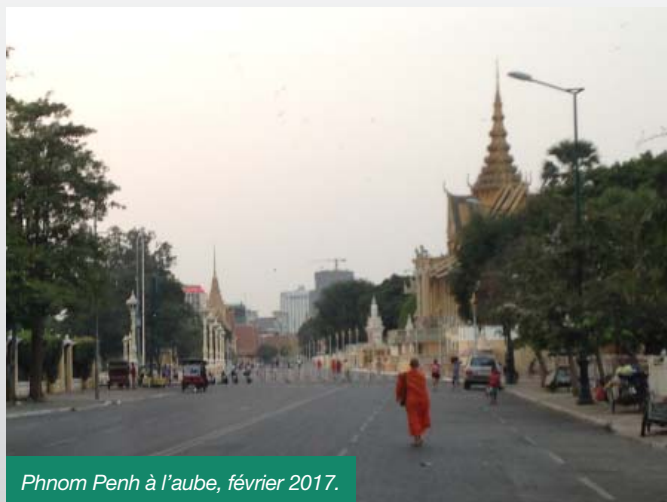
Phnom Penh à l'aube, février 2017.

Plus tôt en 2015, sous l'impulsion de Gentien Piaget, j'eus le plaisir de rencontrer la Princesse du Cambodge Soma Norodom en Californie. Elle m'a raconté comment sa famille a fui le Cambodge et trouvé refuge aux États-Unis quand le régime de Pol Pot a pris le pouvoir. Nous avons discuté des guerres qui ont éclaté dans tout le pays à cette époque et qui ont duré plus de trente ans, ainsi que de la manière dont la terre est marquée