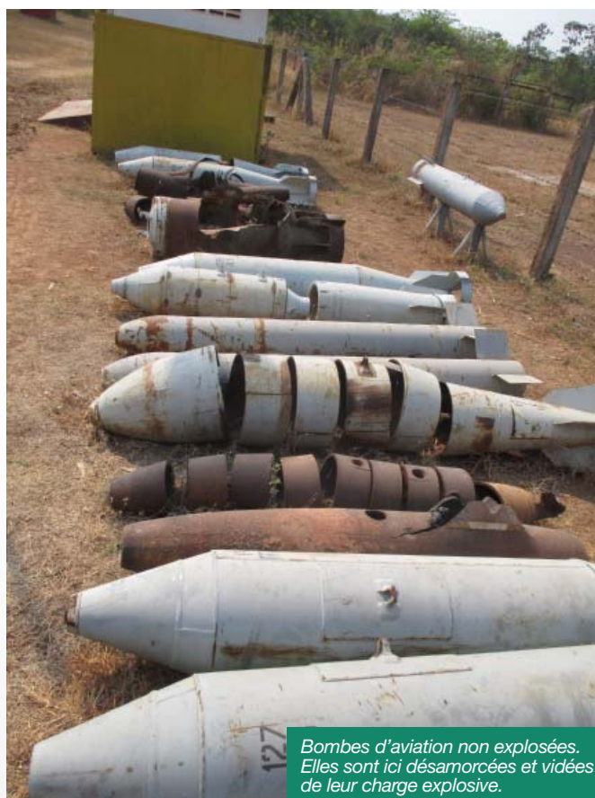
Bombes d'aviation non explosées. Elles sont ici désamorçées et vidées de leur charge explosive.