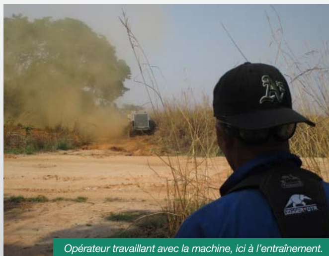
Opérateur travaillant avec la machine, ici à l'entraînement.

Alors que l'équipe angolaise vient de terminer son second champ de mines avec notre machine, dans la province de Huambo, elle sera renforcée par l'arrivée prochaine d'un expert en mécanique de l'organisation The Halo Trust, venu se former à Tavannes au début du mois d'août. Sa présence sur le terrain assurera un excellent suivi technique et opérationnel de la machine. Ainsi, au moment où vous lirez ces lignes, la machine aura entamé son troisième champ de mines avec une équipe au complet. Félicitations à eux ! G. P.