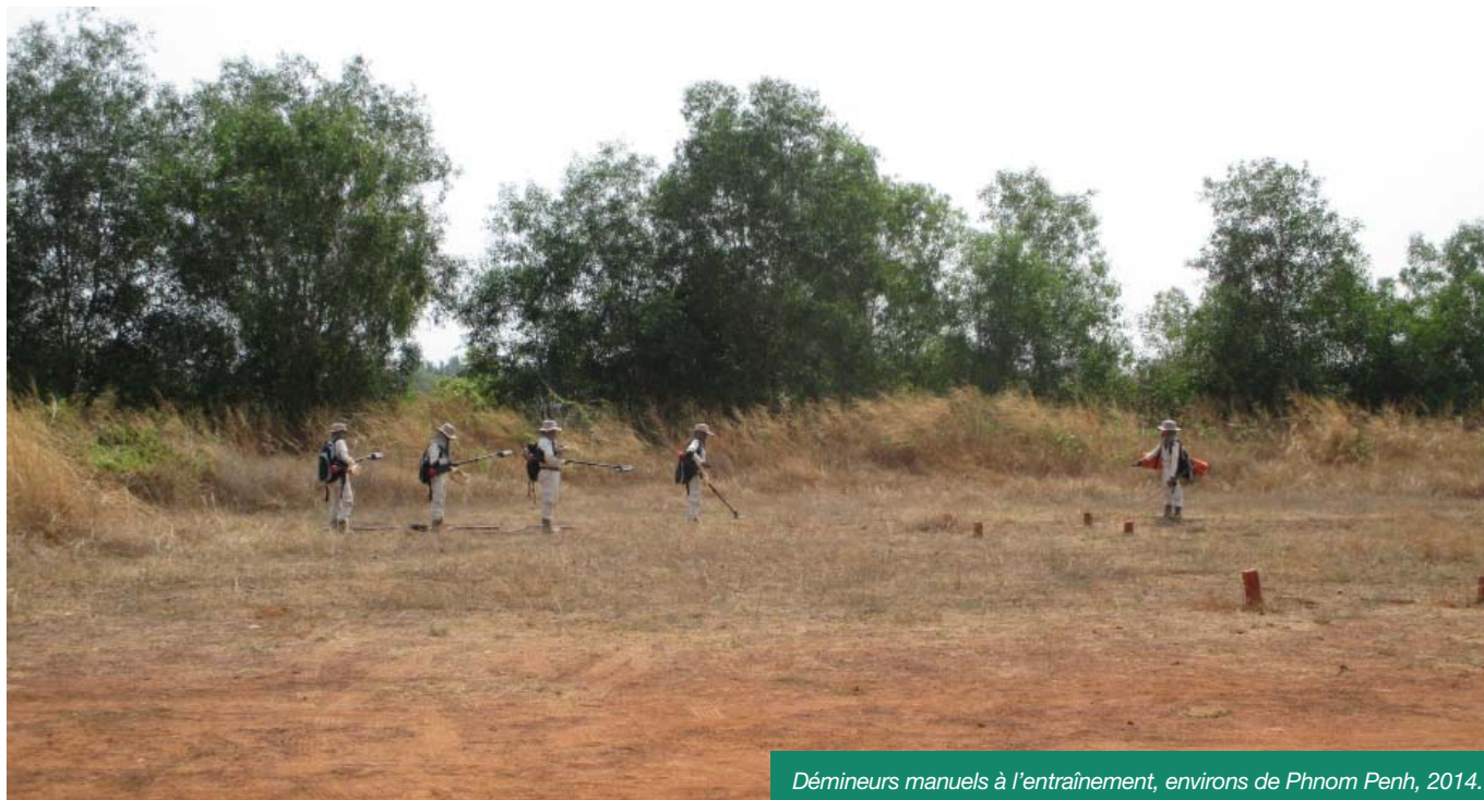
Démineurs manuels à l'entraînement, environs de Phnom Penh, 2014.