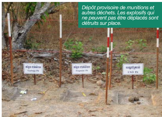
Dépôt provisoire de munitions et autres déchets. Les explosifs qui ne peuvent pas être déplacés sont détruits sur place.